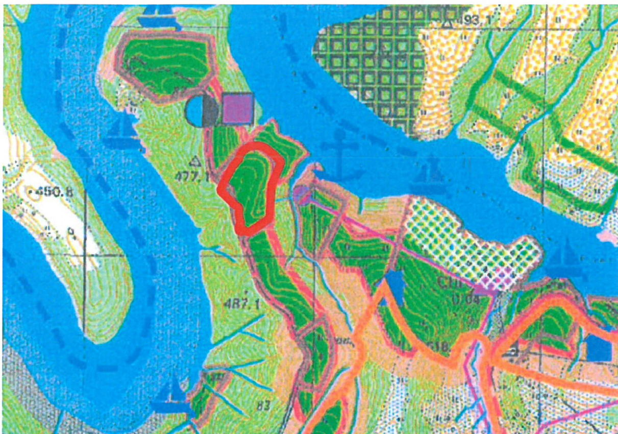
Fragment rysunku Studium Uwarunkowań i Kierunków Zagospodarowania Przestrzennego Gminy Czarna uchwalonego Uchwałą Nr XV/136/01 Rady Gminy Czarna z dnia 24 kwietnia 2001r. z późn.zm.

Ponadto, w części dotyczącej kierunków rozwoju gminy Czarna, zgodnie z zapisami Studium, całą gminę Czarna objęto strefą o dominującej funkcji turystyczno-wypoczynkowej. Strefa ta została wyodrębniona w oparciu o potencjalne czynniki rozwoju, warunki środowiska przyrodniczego i predyspozycje obszaru.