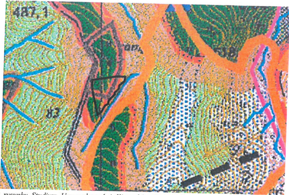
Fragment rysunku Studium Uwarunkowań i Kierunków Zagospodarowania Przestrzennego Gminy Czarna uchwalonego Uchwałą Nr XV/136/01 Rady Gminy Czarna z dnia 24 kwietnia 2001r. z późn.zm.

Ponadto, w części dotyczącej kierunków rozwoju gminy Czarna, zgodnie z zapisami Studium, całą gminę Czarna objęto strefą o dominującej funkcji turystyczno-wypoczynkowej. Strefa ta została wyodrębniona w oparciu o potencjalne czynniki rozwoju, warunki środowiska przyrodniczego i predyspozycje obszaru.