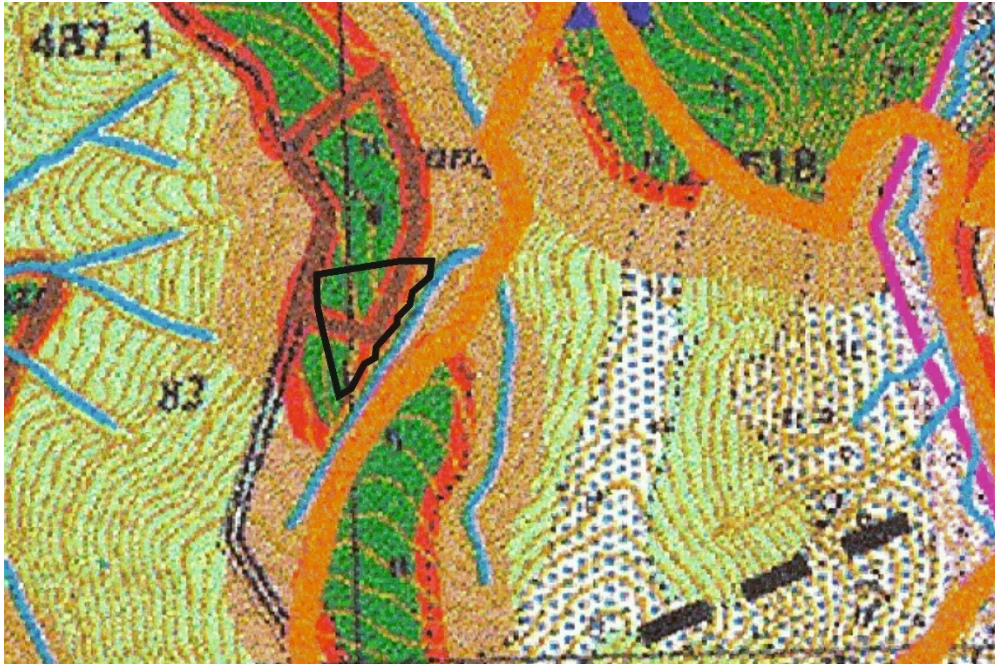
Fragment rysunku Studium Uwarunkowań i Kierunków Zagospodarowania Przestrzennego Gminy Czarna uchwalonego Uchwałą Nr XV/136/01 Rady Gminy Czarna z dnia 24 kwietnia 2001r. z późn.zm.

Ponadto, w części dotyczącej kierunków rozwoju gminy Czarna, zgodnie z zapisami Studium, całą gminę Czarna objęto strefą o dominującej funkcji turystyczno-wypoczynkowej. Strefa ta została wyodrębniona w oparciu o potencjalne czynniki rozwoju, warunki środowiska przyrodniczego i predyspozycje obszaru.