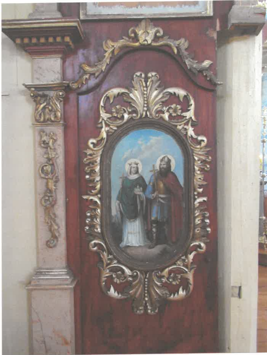
Ikonoostas w Michniowcu, Lewa strona- złocenia wykonane szlagmatalem, zabrudzona powierzchnia mazerunków i polichromii.