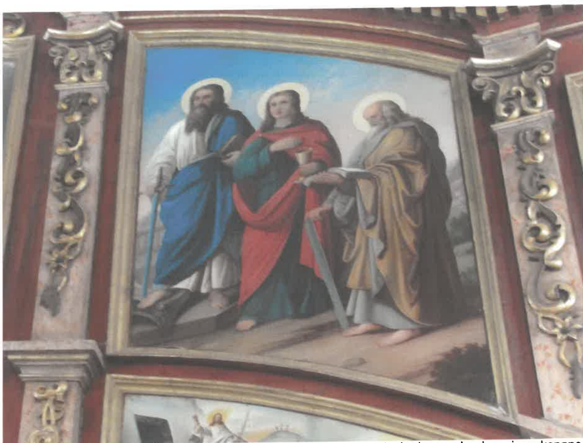
Ikonostas w Michniowcu, Prawa strona- widoczne braki w ornamentach złoconych, złocenia wykonane szlagmatalem. Ramy pokryte zabrudzeniami i oksydowaną powłoką na szlagmetal. Pierwotnie złocenia wykonane złotem płatkowym na pulmencie czerwonym.