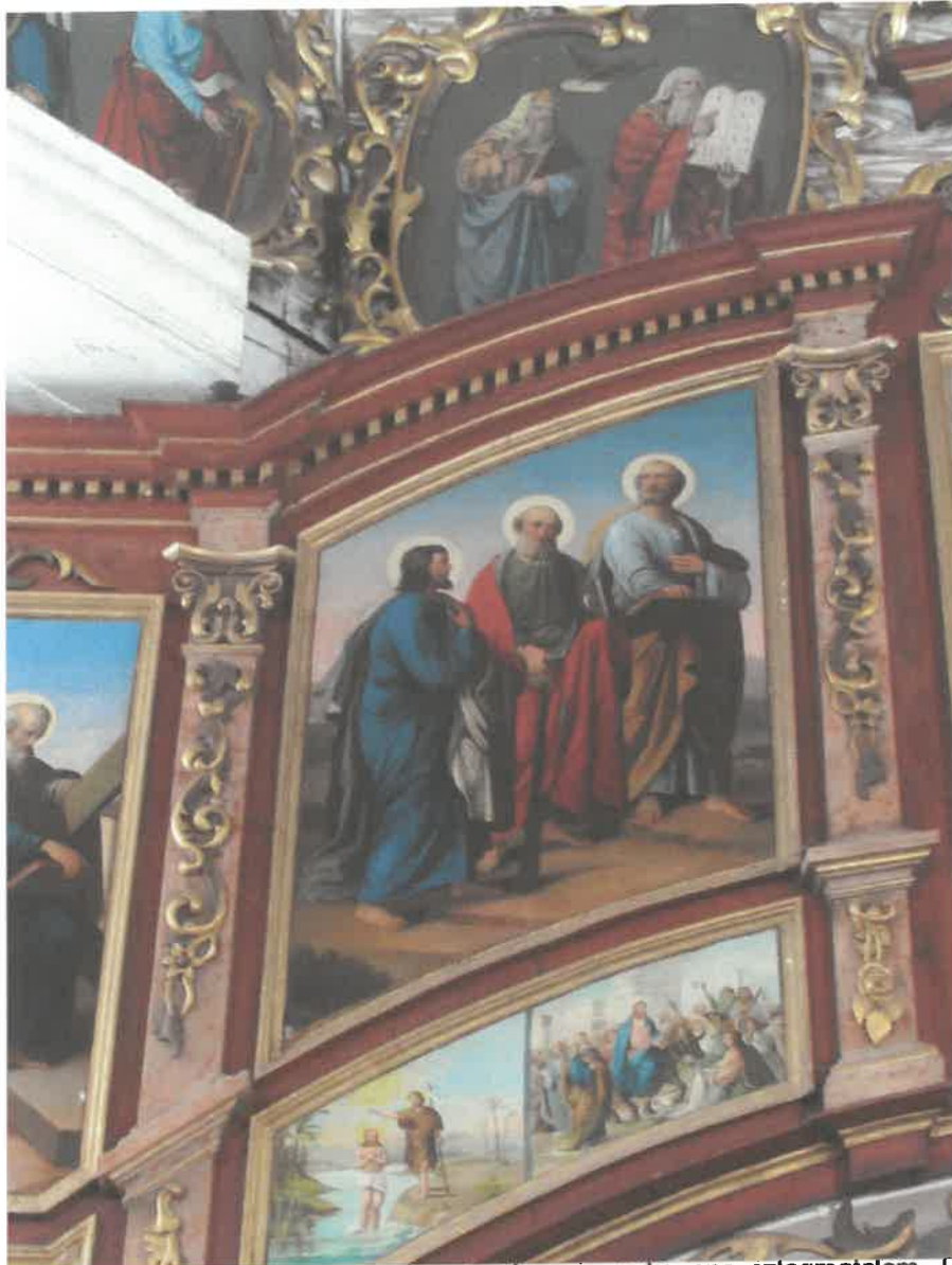
Ikonoostas w Michniowcu, Lewa strona - widoczne złocenia wykonane szlagmatalem. Ramy pokryte zabrudzeniami i oksydowaną powłoką na szlagmetal. Pierwotnie złocenia wykonane złotem płatkowym na pulmencie czerwonym. Zabrudzona powierzchnia polichromii i mazerunków, widoczne drobne ubytki i odrapania.