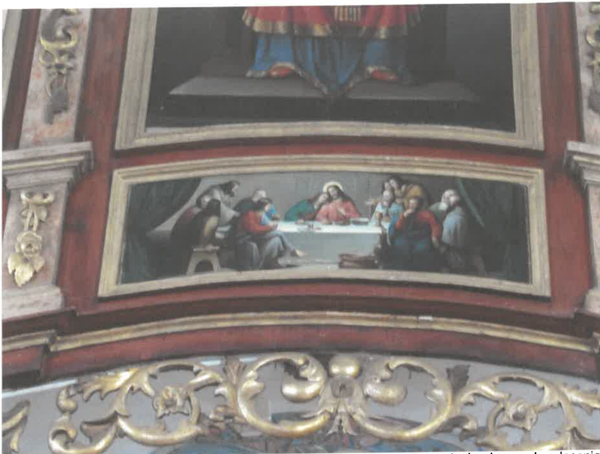
Ikonoostas w Michniowcu, Centralna część - widoczne braki w ornamentach złotonych, złocenia wykonane szlagmatalem. Ramy pokryte zabrudzeniami i oksydowaną powłoką na szlagmetal. Pierwotnie złocenia wykonane złotem płatkowym na pulmencie czerwonym. Zabrudzona powierzchnia polichromii i mazerunków, widoczne drobne ubytki i odrapania.