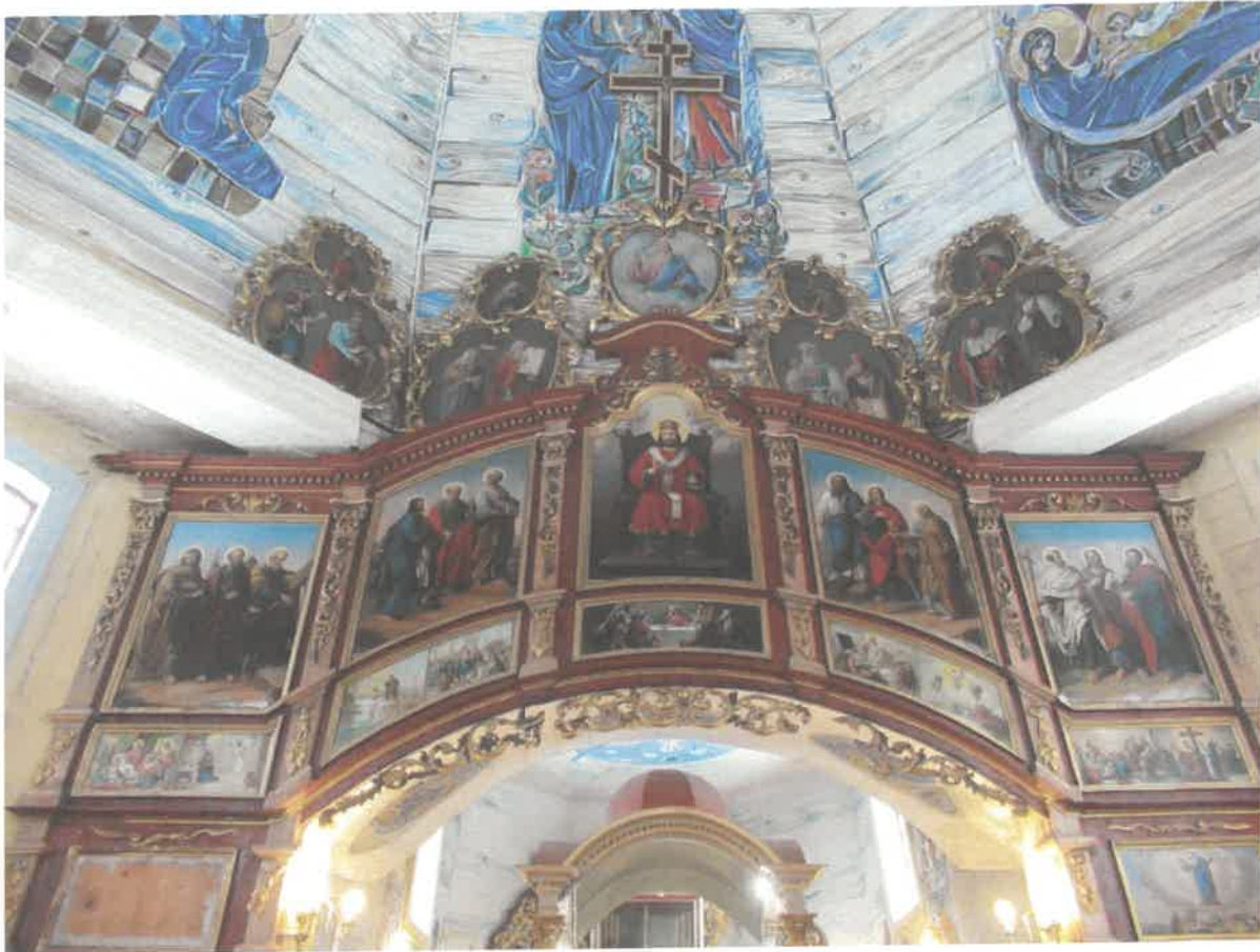
Ikonostas w Michniowcu, górna część- widoczne braki w ornamentach złotych, z lewej strony ikonostasu brak ikony Narodzenie NMP, złocenia wykonane szlagmatalem.