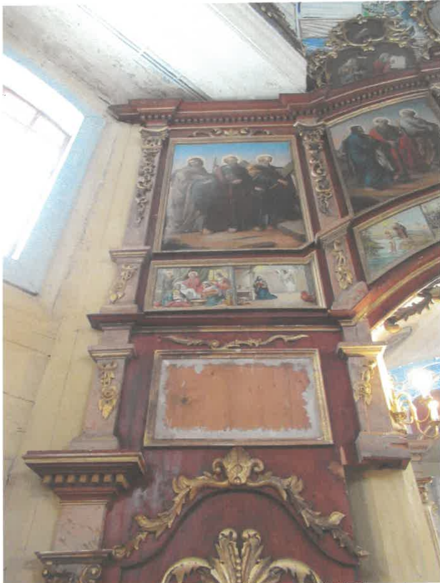
○ Ikonostas w Michniowcu, Prawa strona- widoczne braki w ornamentach złoconych, z prawej strony ikonostasu brak ikony Narodzenie NMP, złocenia wykonane szlagmatalem.