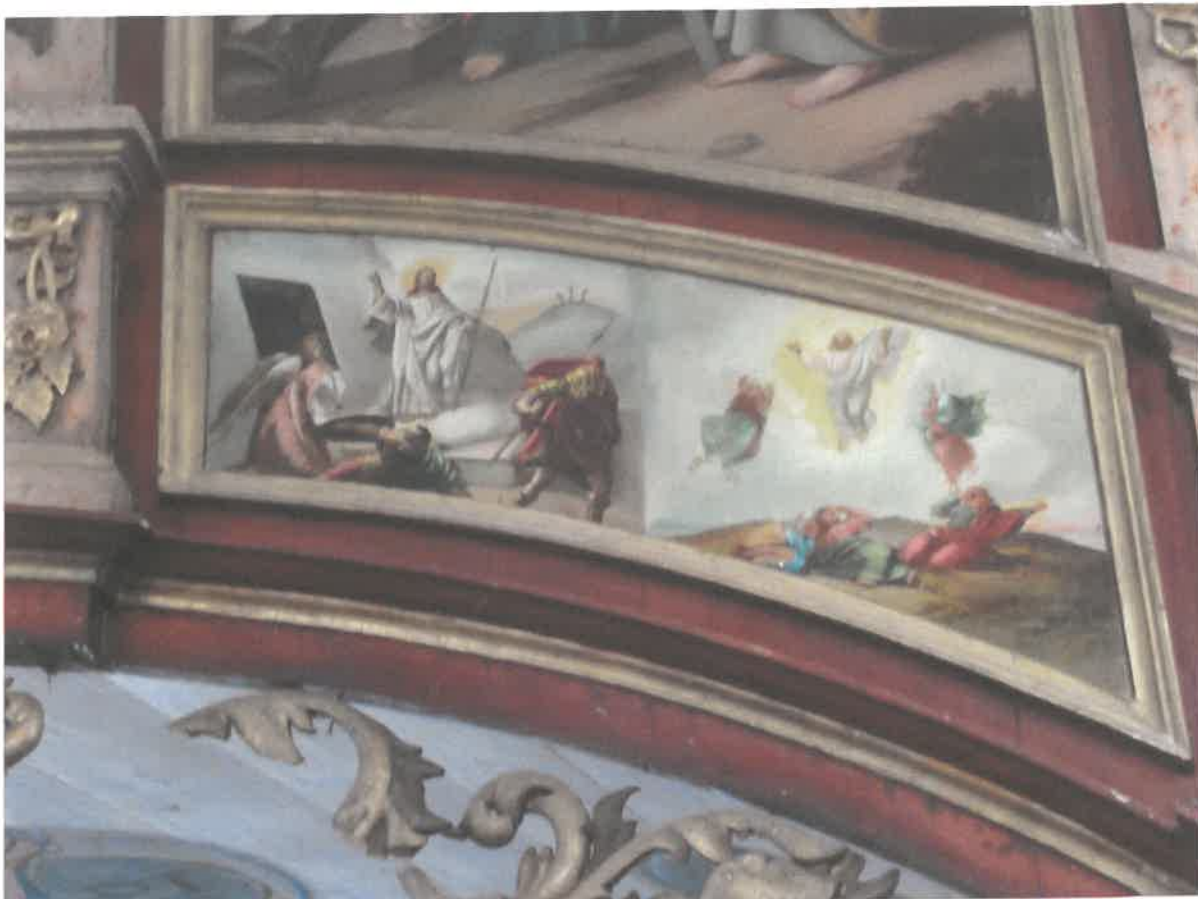
Ikonoostas w Michniowcu, Prawa strona- widoczne braki w ornamentach złoconych, złocenia wykonane szlagmatalem. Ramy pokryte zabrudzeniami i oksydowaną powłoką na szlagmetal. Pierwotnie złocenia wykonane złotem płatkowym na pulmencie czerwonym. Zabrudzona powierzchnia polichromii i mazerunków, widoczne drobne ubytki i odrapania. Ikony zabrudzone.