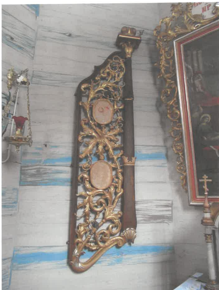
Ikonoostas w Michniowcu- carskie wrota strona lewa- widoczne złocenia wykonane szlagmatalem. Pierwotnie złocenia wykonane złotem płatkowym na pulmencie czerwonym. Brak dwóch ikon w formie medalionów.