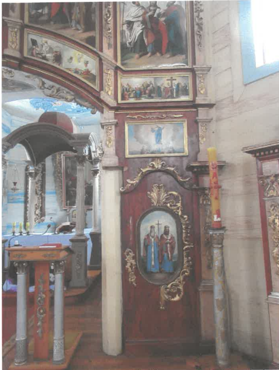
Ikonoostas w Michniowcu, Prawa strona- widoczne braki w ornamentach złoconych, złocenia wykonane szlagmatalem.