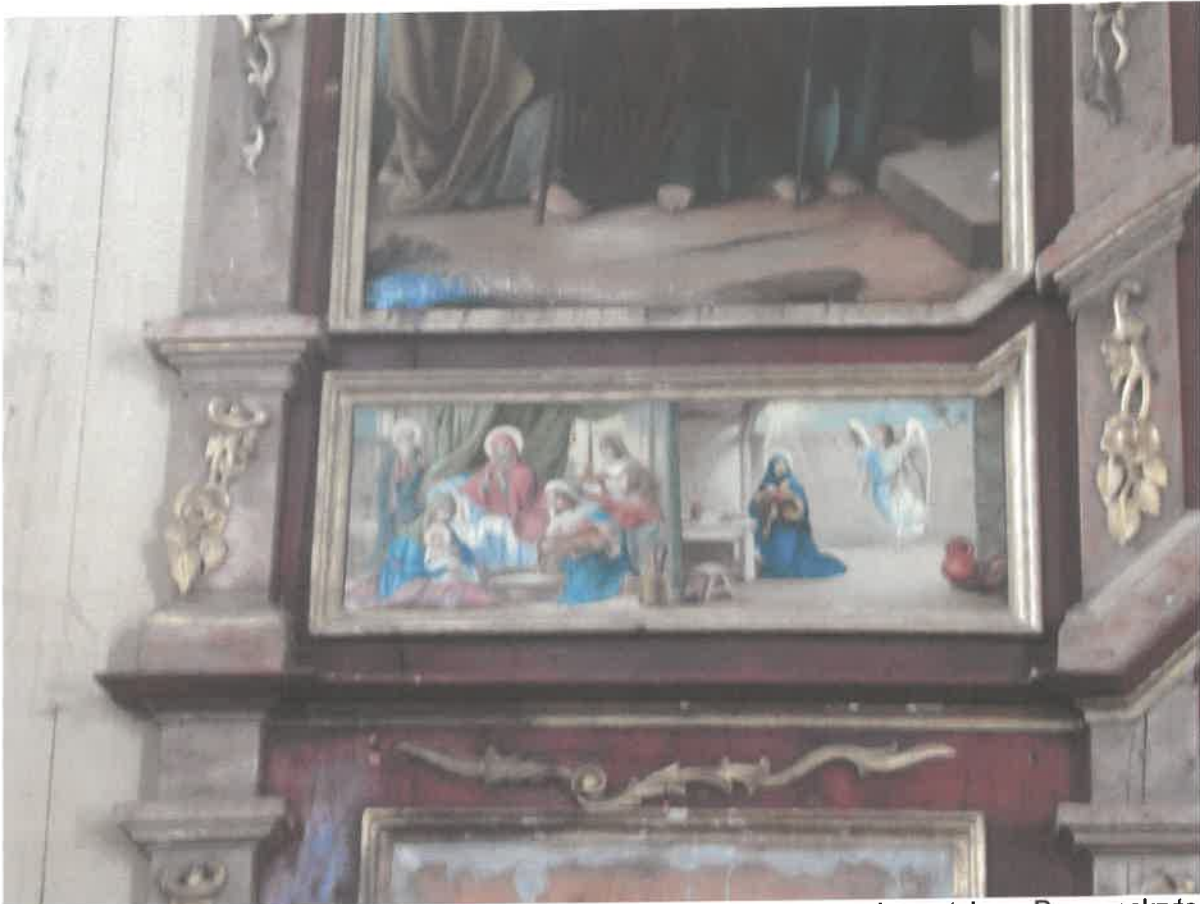
Ikonoostas w Michniowcu, Lewa strona - widoczne złocenia wykonane szlagmatalem. Ramy pokryte zabrudzeniami i oksydowaną powłoką na szlagmetału. Pierwotnie złocenia wykonane złotem piatkowym na pulmencie czerwonym. Zaburzona powierzchnia polichromii i mazerunków, widoczne drobne ubytki i odrapania