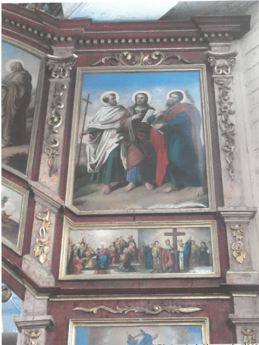
Ikonostas w Michniowcu, Prawa strona- widoczne braki w ornamentach złożonych, złączenia wykonane szlagmatalem .