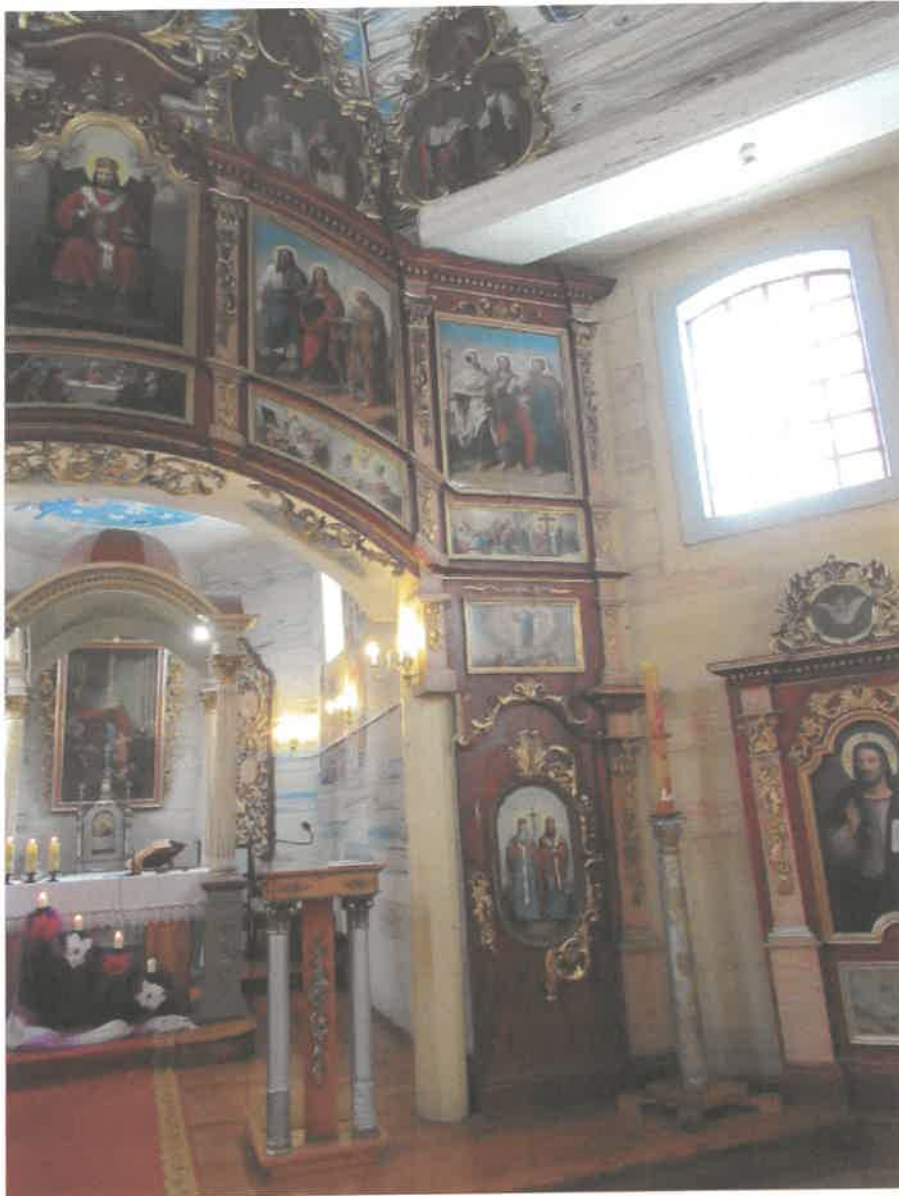
Ikonoostas w Michniowcu, Prawa strona- widoczne braki w ornamentach złożonych, , złączenia wykonane szlagmatalem.