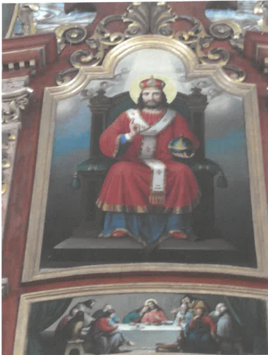
Ikonostas w Michniowcu, Centralna część - Ramy pokryte zabrudzeniami i oksydowaną powłoką na szlagmetal. Pierwotnie złocenia wykonane złotem płatkowym na pulmencie czerwonym. Zabrudzona powierzchnia polichromii i mazerunków, widoczne drobne ubytki i odrapania. Ikona z przedstawieniem Chrystusa Archijereja w stanie dobrym.