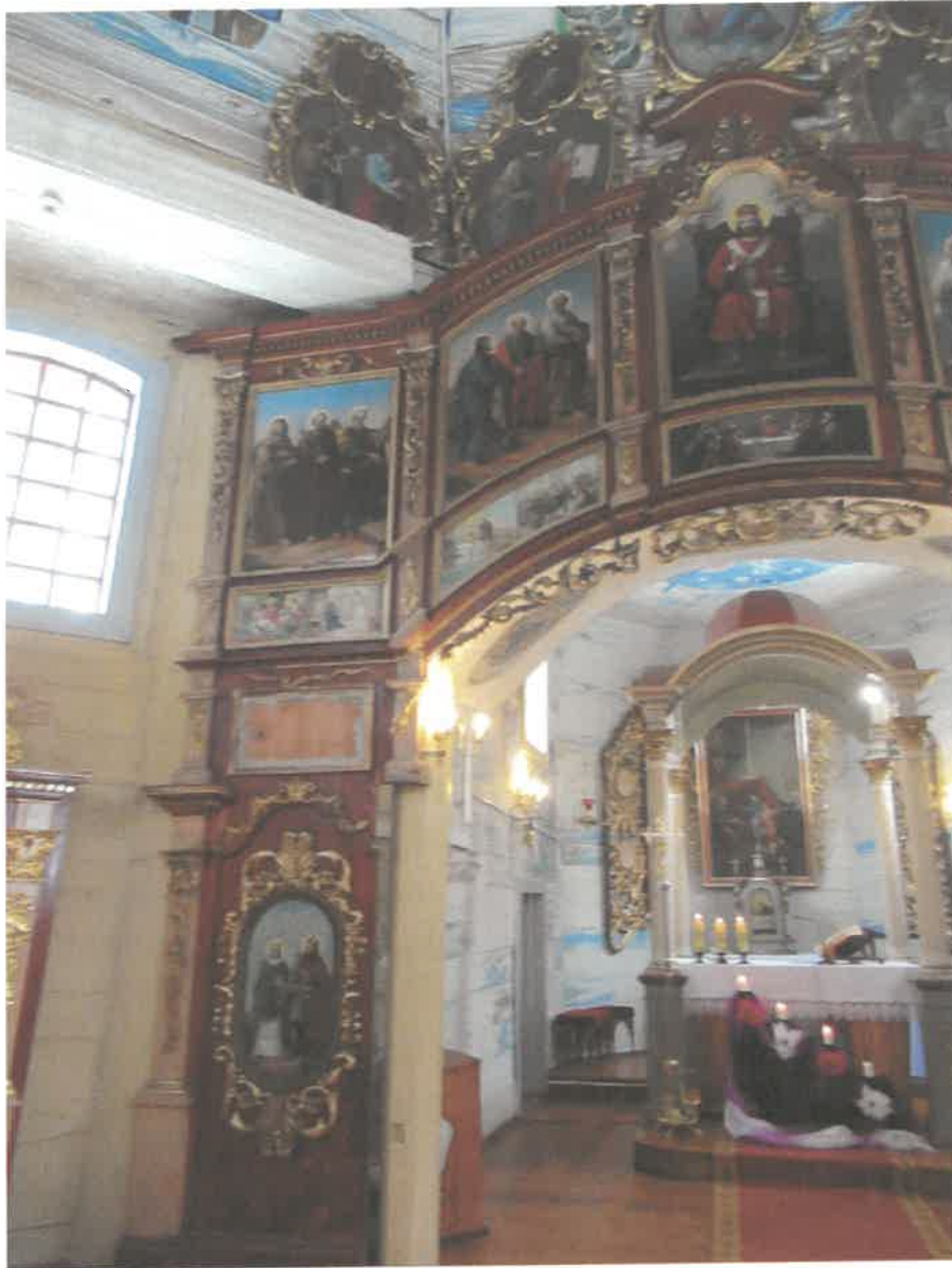
Ikonoostas w Michniowcu, Lewa strona- widoczne braki w ornamentach złożonych, z lewej strony ikonoostasu brak ikony Narodzenie NMP, złączenia wykonane szlagmatalem.