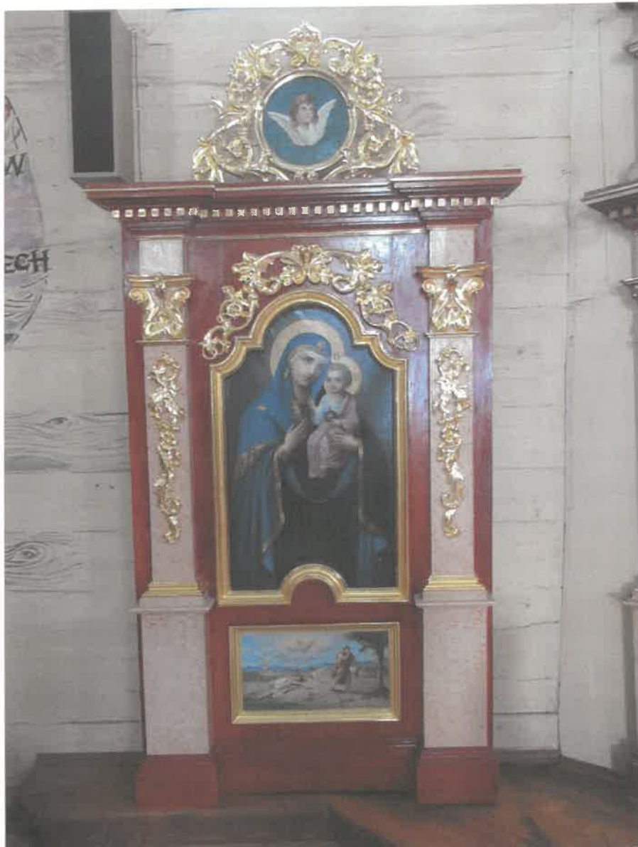
Ikonoostas w Michniowcu/ Odłączony fragment z ikoną z wizerunkiem Matki Bożej z Dzieciątkiem, w zwieńczeniu uskrzydłona główka aniołka. Cały element po konserwacji.