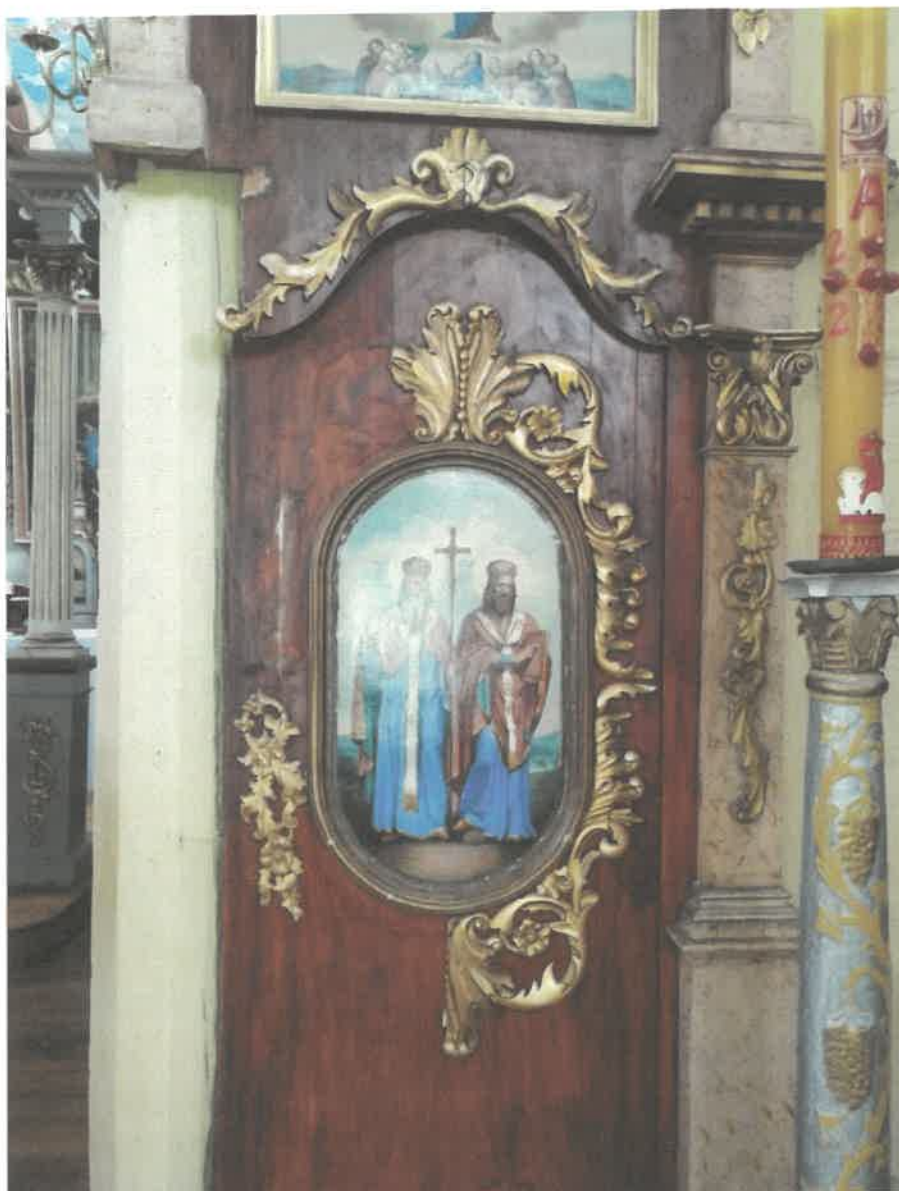
Ikonostas w Michniowcu-Prawa strona ikonostasu- dolna część. Brak ornamentów snycerskich złożonych. Odrapania i uszkodzenia w obrębie ramy ikony. Powierzchnia mazerunków zabrudzona.